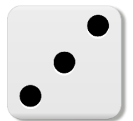
Obraz 1. kosc3.png

Uwaga: W języku Python należy utworzyć jeden konstruktor z domyślną wartością argumentu None